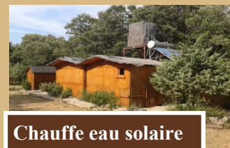
Chauffe eau solaire